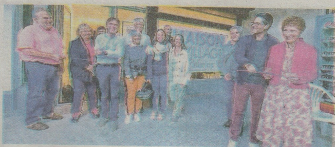
Des services au plus près des habitants.