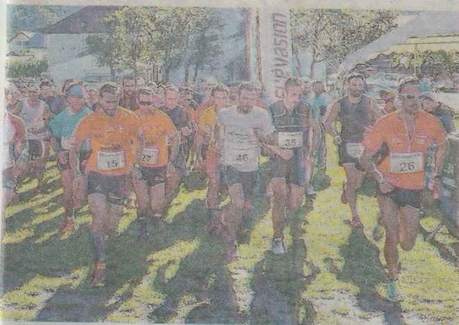
adultes sera donné à 11 heures.

vététiste et s'élance pour 10 km sur les chemins.